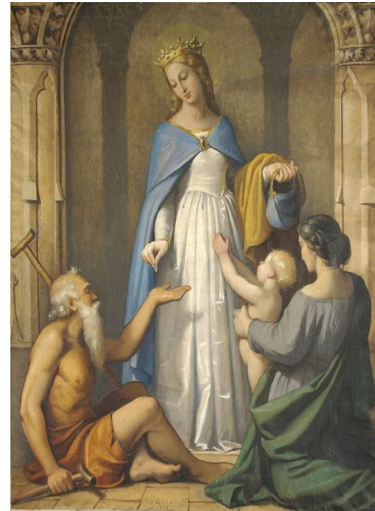
Subventions du ministères à l'ESR (allégorie) #ESRenpeinture