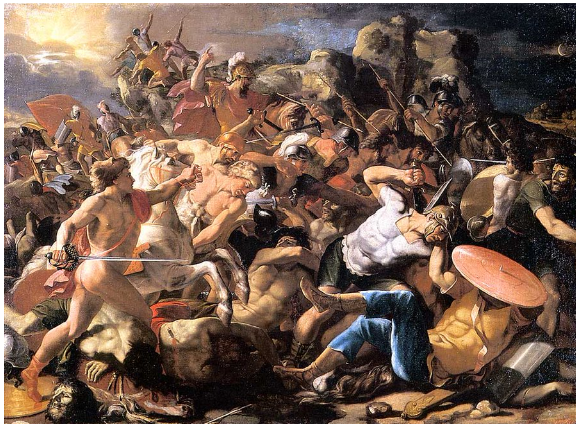
EC prêts à défendre l'université contre la LPPR #ESRenpeinture