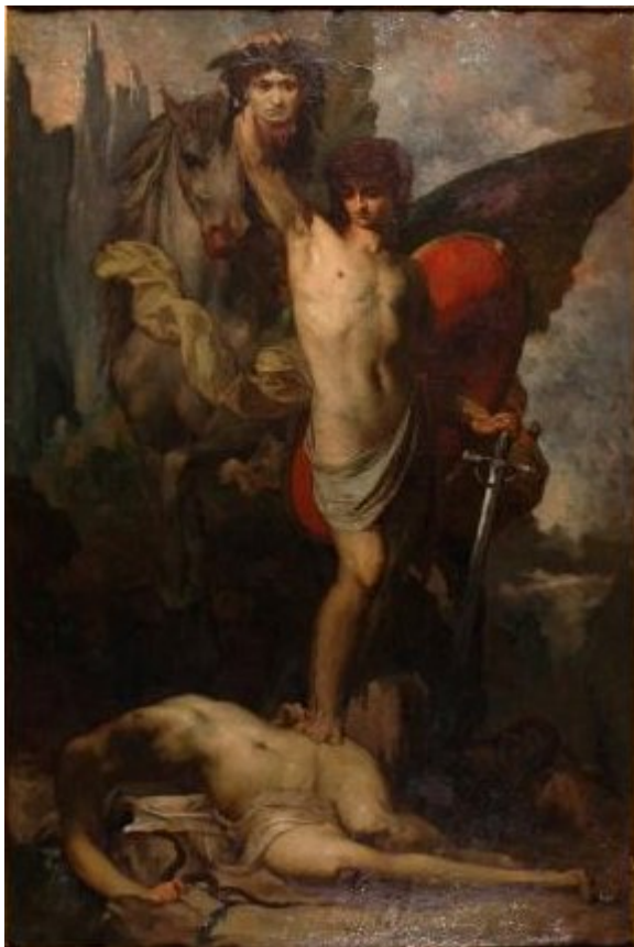
La LPPR décapitant l'ESR #ESRenpeinture