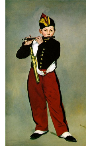
Ministre présentant la LPPR et ses bienfaits #ESRenpeinture