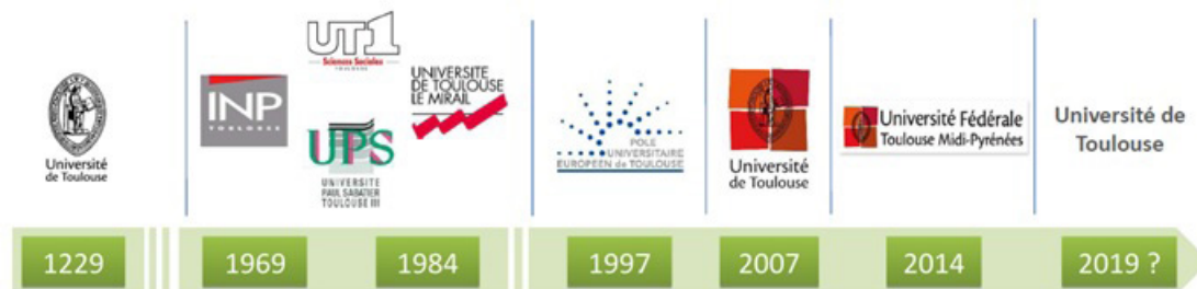
Les trois universités toulousaines n'ont été séparées qu'en 1969.

L'iDEX, c'est construire une université toulousaine qui puisse être concurrentielle face aux universités voisines de Bordeaux et Montpellier. L'iDEX, c'est fermer la parenthèse ouverte en 1968 et, 50 ans après, revenir sur ses principaux acquis, notamment le rejet de la sélection que C. De Gaulle et A. Peyrefitte voulaient imposer à la jeunesse d'alors. La présentation faite aux personnels le 23 novembre 2017 est on ne peut plus explicite :