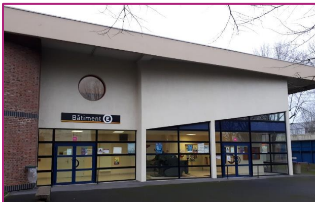
Le bâtiment E