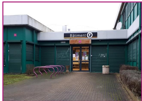
Le bâtiment F