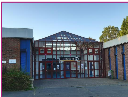
Le bâtiment C